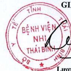
Lương Đức Sơn